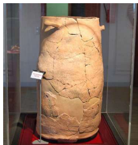
Possible rusc d'abelles, mitjans segle VII a.n.e.