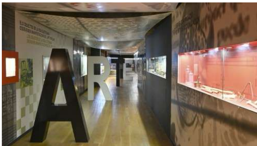
Inici exposició arqueològica. Fotografia del Museu de Belles Arts de Castelló.

En entrar al museu, que és d'entrada gratuïta, et comenten que no és possible fer fotografies, per tant, no es poden aportar imatges en aquest segment. Tampoc t'acompanya cap guia; és una visita lliure per tot el museu.