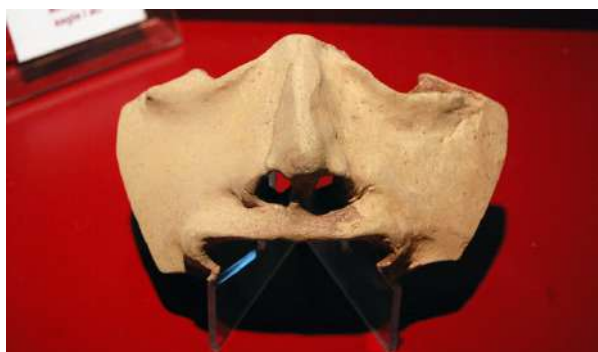
Màscara d'argila, gelge I a.n.e.

La vitrina número cinc d'aquesta segona sala conté un fragment de màscara restaurada elaborada amb argila. La màscara, que representa la part central de la cara, es va trobar molt allunyada de qualsevol espai escènic o d'ambient teatral. Per tant, es creu que degué utilitzar-se per algun ritual. Una altra peça curiosa la podem trobar a la següent vitrina: un possible rusc d'abelles. Es tracta d'un recipient cilíndric modelat a mà d'argila rogenca. Es creu que podria ser un rusc, ja que a la part inferior presenta un orifici menut.