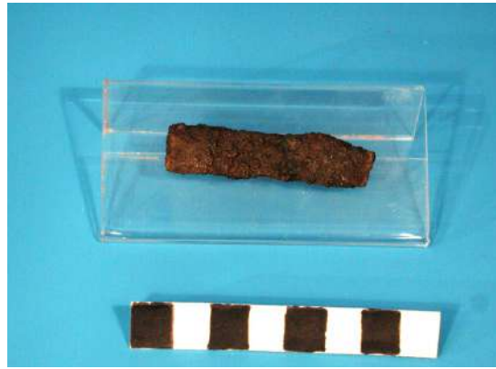
Fragment fulla de ganivet, segle VII a.n.e.