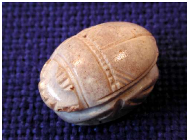
Part superior tallada en forma d'escarabat.

A les següents vitrines ens presenten diferents peces de ceràmica: una gerra o pitxer bitroncocònica, un plat troncocònic, un atuell de perfil globular i una copa de perfil caliciforme. Totes elles elaborades a mà formen part del mateix moment d'ocupació.