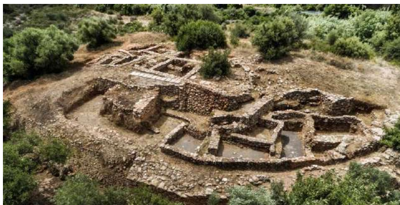
Vista aèria del Torrelló.