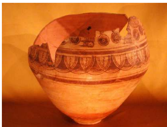
Gran urna cinerària, segle II a.n.e.

Finalment, la vitrina sis d'aquesta primera planta està dedicada a la mort i als soterraments ibèrics. És per això que aquí trobem diferents urnes o recipients que es col·locaven junt l'aixovar personal, així com els propis elements d'aquests aixovars funeraris. D'aquesta manera, podem observar diferents peces per l'aixovar masculí (guerrer) i el femení (arracades, botelles de perfum, etc.).