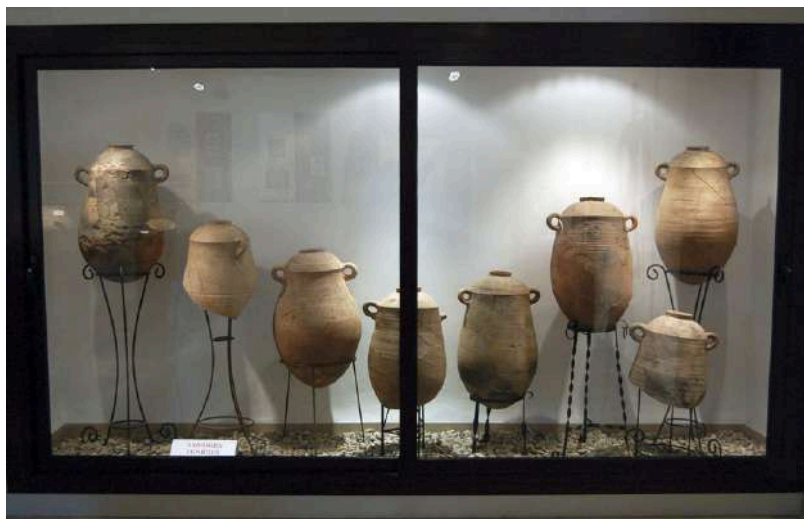
Conjunt àmfores fenícies, segle VII a.n.e.

devers el segle VII a.n.e. i l'estudi del seu contingut ha permès determinar que es tractava d'un comerç de vi i garum (salsa de peix).