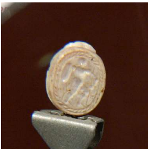
Part inferior on es pot veure el guerrer amb l'escut.

A l'esquerra de la sala i com a peça essencial del museu trobem una petita pedra semipreciosa coneguda com a cornalina tallada en forma d'escarabat. A la part inferior es pot apreciar a un guerrer preparat per la batalla amb un escut ovalat, la javelina i un casc, envoltat tot per una orla amb forma de corda. Data del segle V a.n.e. i com es pot apreciar està en perfecte estat de conservació. La pedra d'uns 1,5 cm presenta dos petits forats als costats que es creu que eren per col·locar-lo a un anell.