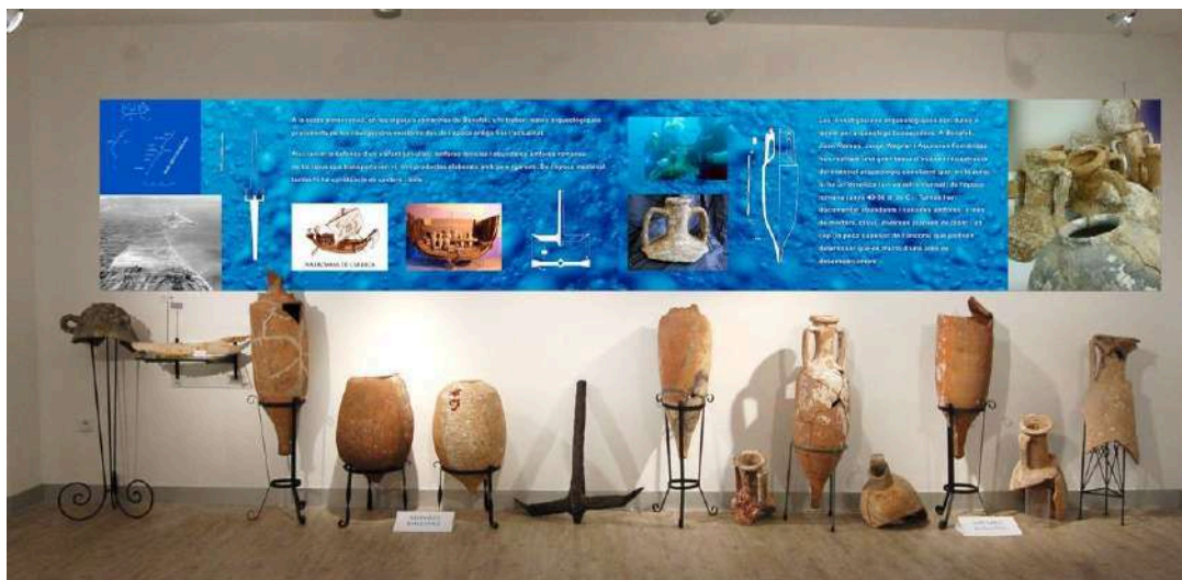
Vista del conjunt del jaciment submergiu de Benafeli, segle VI a.n.e; segle I a.n.e – II d.n.e.

romanes tant restaurades com incompletes, una àncora i un ullal d'elefant molt degradat. Al panell informatiu s'ofereix una vista aèria del lloc a finals dels anys 50, així com unes imatges de naus romanes i una fotografia del moment en què els bussejadors arqueòlegs troben un fragment d'àmfora.