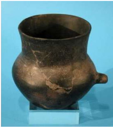
Biberó, segle VIII a.n.e.