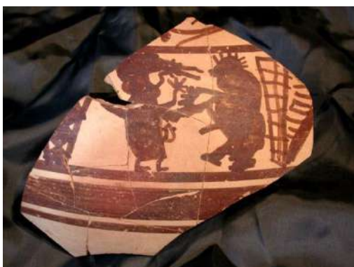
Fragment de lebes amb una possible figura femenina amb un diaulos i una possible figura masculina ballant, anys 200-150 a.n.e.