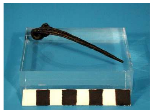
Fragment d'agulla passadora de doble ressort, segle VII a.n.e.