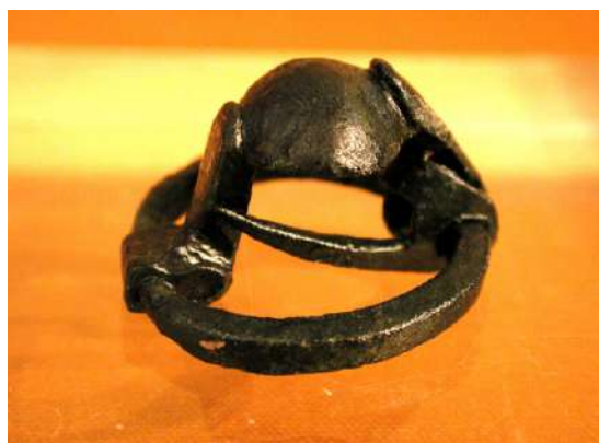
Fibula anul·lar, pertanyent a un aixovar femení, segle IV a.n.e.

A la segona planta de l'edifici es troba la segona sala amb un sistema expositiu diferent a la primera, amb més vitrines individuals en lloc conjunts tancats. Un d'aquests conjunts que es poden observar és el de vuit àmfores fenícies restaurades procedentes de l'actual Màlaga. Arribaren al Torrelló per mitjà del comerç marítim del Mediterrani