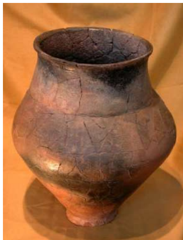
Gerra o pitxer bitroncocònic, segle VII a.n.e.

Arqueològicament es considera un període molt ric degut a que els seus habitants degueren abandonar el Torrelló a causa d'un conflicte bèl·lic.