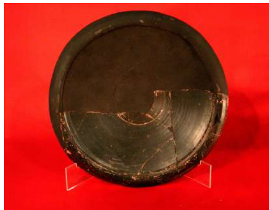
Plat de varins negre, ceràmica campanina, segle II a.n.e.

Finalment, la vitrina sis d'aquesta primera planta està dedicada a la mort i als soterraments ibèrics. És per això que aquí trobem diferents urnes o recipients que es col·locaven junt l'aixovar personal, així com els propis elements d'aquests aixovars funeraris. D'aquesta manera, podem observar diferents peces per l'aixovar masculí (guerrer) i el femení (arracades, botelles de perfum, etc.).