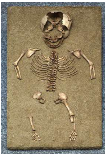
Enterrament infantil, segle VII a.n.e.