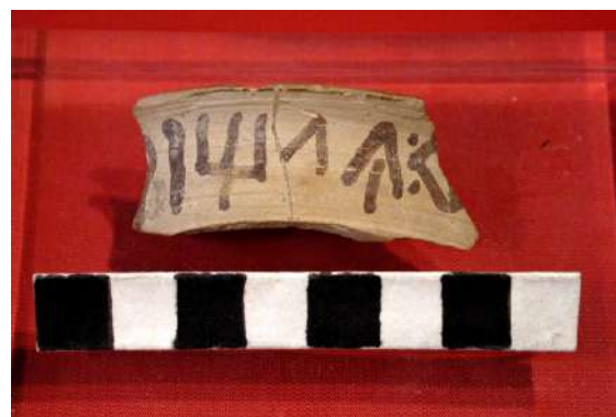
Fragment de vora de cilix escrit amb inscripció, segle II a.n.e.

Per acabar, al final de la sala s'observen dos conjunts separats: el primer correspon a una figuració d'un soterrament infantil, que disposa de dos maniquins i les restes d'un nounat com el de la primera sala. El segon conjunt es tracta d'algunes troballes del jaciment submarí de Benafelí. Aquest està situat a la costa sud de la localitat d'Almassora, aproximadament 5 km al sud del port de Castelló. Es tracta d'un jaciment que es troba a mar oberta i a poca profunditat, a més està molt danyat a causa de l'erosió costanera i a la construcció del port de Castelló fins al segle XIX. (Melchor Monserrat, 2019). Al Museu podem veure una mostra d'àmfores