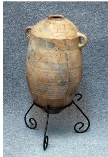
Àmfora fenícia, segle VII a.n.e.

A les vitrines tres i quatre continuen les peces ceràmiques realitzades a mà d'entorn el 650 fins al 570 a.n.e.: vaixel·la de cuina i recipients utilitzats com a contenidors. No obstant, apareixen noves peces de ferro com la fíbula o imperdibles de doble ressort. Com a novetat per l'època, a la vitrina 4 apareixen les primeres formes ibèriques: les àmfors, que serveixen per transportar i comercialitzar productes.