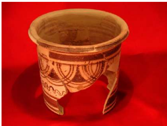
Càlat, barret de copa; segles III-II a.n.e.

A la vitrina cinc ja ens trobam amb peces plenament ibèriques on es pot apreciar el total desenvolupament del torn de terrissaire. També son notables les decoracions, que son de color roig vinós, i que passen de dibuixos geomètrics a temes vegetals i antropomorfs. Apareixen també ceràmiques importades d'Itàlia, com la ceràmica campanina.