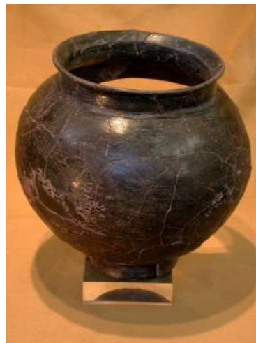
Atuell de perfil globular, segle VII a.n.e.

La vitrina número cinc d'aquesta segona sala conté un fragment de màscara restaurada elaborada amb argila. La màscara, que representa la part central de la cara, es va trobar molt allunyada de qualsevol espai escènic o d'ambient teatral. Per tant, es creu que degué utilitzar-se per algun ritual. Una altra peça curiosa la podem trobar a la següent vitrina: un possible rusc d'abelles. Es tracta d'un recipient cilíndric modelat a mà d'argila rogenca. Es creu que podria ser un rusc, ja que a la part inferior presenta un orifici menut.