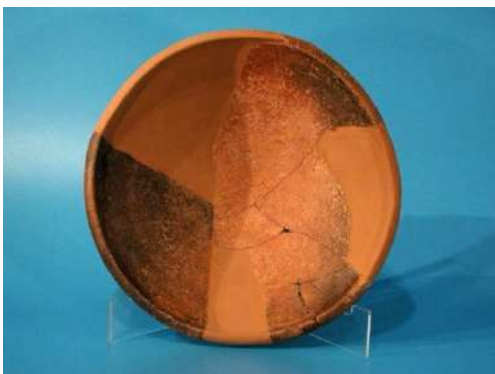
Plat fenici modelat a torn, segle VII a.n.e.

A les vitrines tres i quatre continuen les peces ceràmiques realitzades a mà d'entorn el 650 fins al 570 a.n.e.: vaixel·la de cuina i recipients utilitzats com a contenidors. No obstant, apareixen noves peces de ferro com la fíbula o imperdibles de doble ressort. Com a novetat per l'època, a la vitrina 4 apareixen les primeres formes ibèriques: les àmfors, que serveixen per transportar i comercialitzar productes.