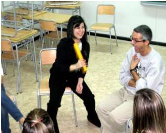
Jugando en un barracón al teatro con el alumnado de griego

Imposible transmitir algo si no disfrutamos sinceramente con ello. Aquí jugando al 'objeto imaginario' con un folio de colores.