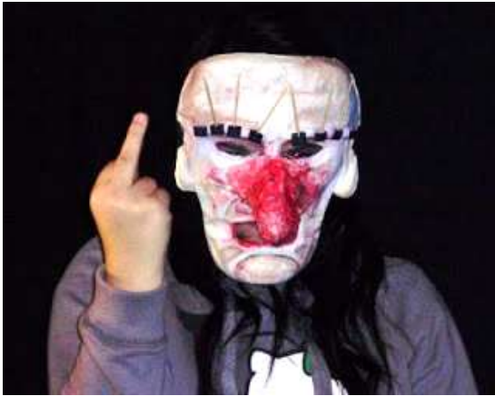
Un 'senex' cascarrabias