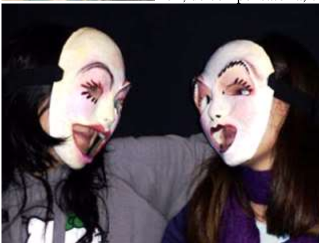
Dos jóvenes enamorados