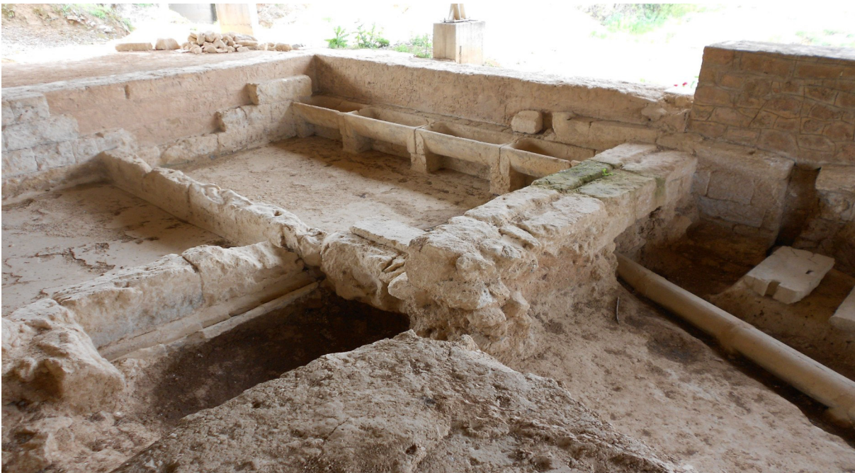
Restes arqueològiques dels banys de Nemea.

Doncs bé, aquest exèrcit d'argius va parar a Nemea i, cansats del viatge, els soldats buscaven una font per fer les libacions rituals i garantir-ne la victòria a la guerra que els esperava. Hipsípila, que se'ls va trobar mentre es feia càrrec del xiquet, els va indicar on hi havia una font i, per fer-ho, el va deixar un moment a terra, amb tan mala sort que el va mossegar una serp i va morir. Els reis entraren en còlera, però Amfiarau, cabdill de l'exèrcit, va convèncer Licurg i la seua dona, Eurídice, que no mataren Hipsípila i els va ajudar a organitzar els funerals d'Ofeltes, que finalment es convertiren en els Jocs Nemeus, en honor del xiquet.