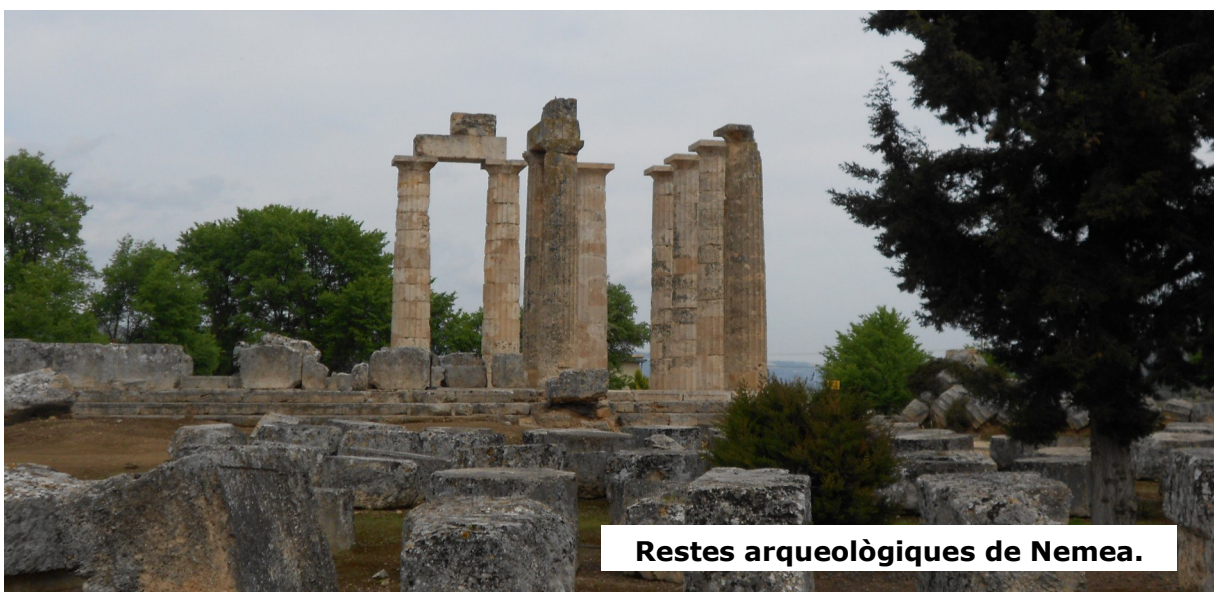
Restes arqueològiques de Nemea.

Sabem, perquè ho conta Apol·lodor a la seua Biblioteca Mitològica , que poc després de l'infantament dels bessons, les lèmnies descobriren l'engany d'Hipsípila, que havia salvat el seu pare, i la condemnaren a l'esclavitud. Finalment, Hipsípila va ser venuda a Licurg, rei de Nemea, que li va encarregar fer de dida del seu fill, Ofeltes.